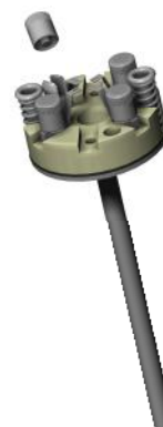
Рис. 6. ТС исполнение 7 (тип PL головка)