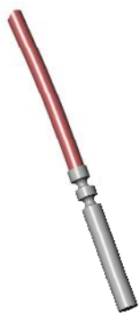
Рис. 1 ТС исполнение 1 (тип PL кабель)

Фото внешнего вида одного ТС, из которых подбираются комплекты, приведены на рисунках 1-6.