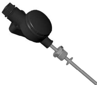
Рис. 2. ТС исполнение 2 (тип DL головка)