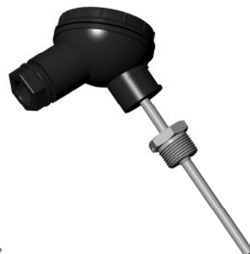
Рис. 3. ТС исполнения 3 (тип DL головка)